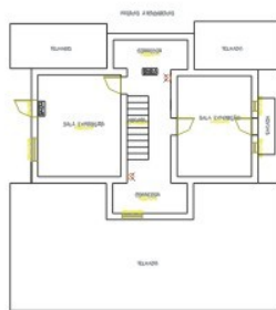
MUSEU PALEO ARQUEOLÓGICO E HISTÓRICO DE TAIÓ RUA CEL FEDERSEN, 111 - SEMINÁRIO - TAIÓ - S PAVIMENTO 2 ESC : 1/100